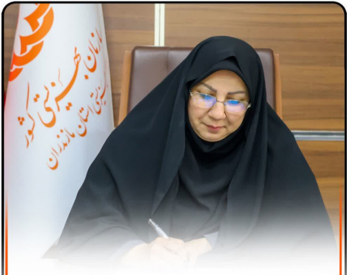
یادداشت روزملی ارتباطات و روابط عمومی؛