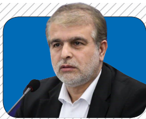
دادگستری مازندران پیگیر مطالبات مردمی از شهرداری ها شد