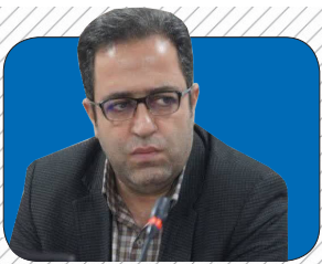
تبدیل ۷۱ مخزن فرسوده به سیستم بسته در مازندران