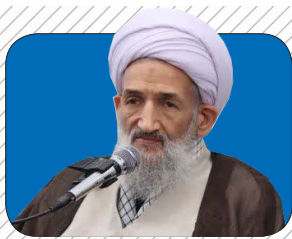
تجمعات مردمی سرمایه بی نظیر اسلام و انقلاب است