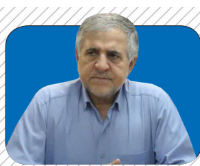
نخستین نشاء مکانیزه برنج مازندران در روستای دارابکلای میانرود