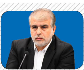
بازگشت کارخانه مواد شوینده به چرخه تولید در قائمشهر با ورود دستگاه قضائی مازندران