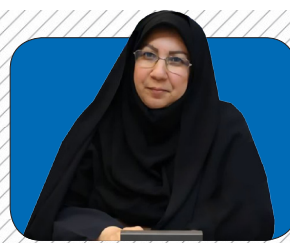
مدیرکل بهزیستی مازندران: آماده‌باش تمام‌عیار بهزیستی استان مازندران برای آرامش روان جامعه