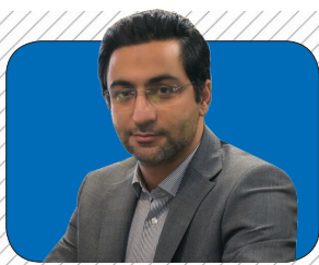
تولیدات دامی مازندران در شرایط جنگ تداوم یافت