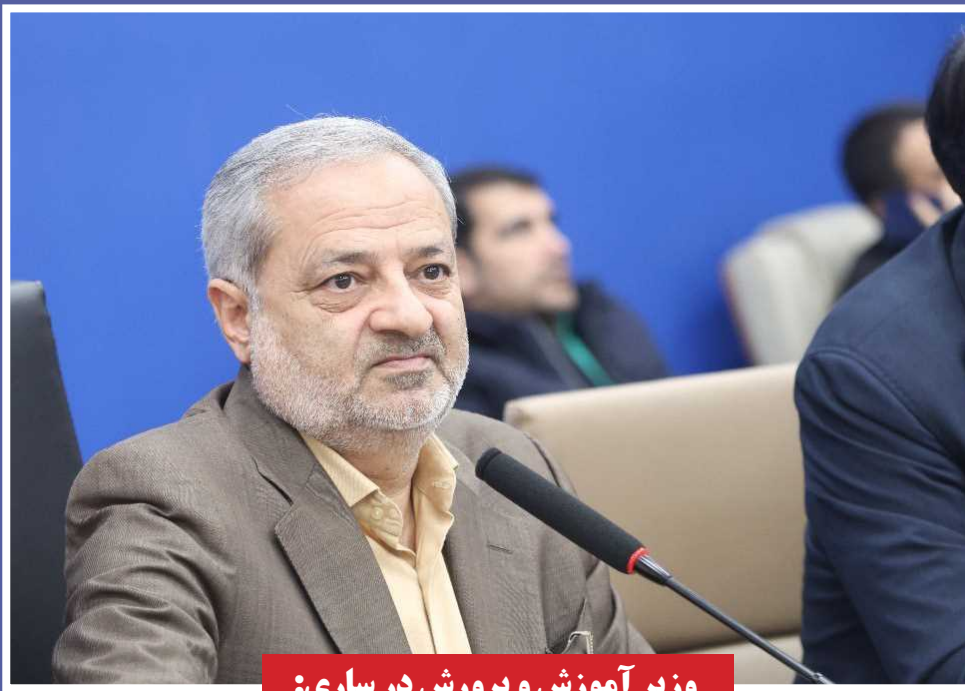
وزیر آموزش و پرورش در ساری:

۸ هزار طرح آموزشی، برای اجرای عدالت آموزشی در کشور در دست اجراست