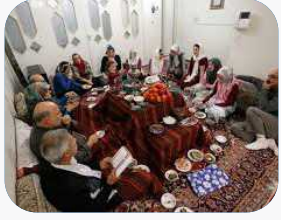
توصیه کارشناس مرکز بهداشت شب یلدا تا حد امکان دیده بوسی نکنید