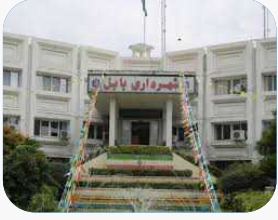
شورای شهر بابل در عزل و نصب هار کورد زده؛ انتخاب هفت شهردار طی چهار سال!