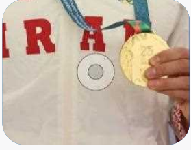
مدیرکل ورزش و جوانان قم خبر داد: کسب ۳۶ مدال آسیایی، جهانی و پارالمپیک توسط ورزشکاران قم