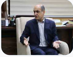
استاندار گیلان خواستار همکاری بانک‌ها در پروژه‌های زیربنایی شد