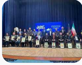
مدیرکل فرهنگ و ارشاد اسلامی مازندران تأکید کرد: قدردانی از چهره‌های ماندگار، گامی مؤثر در صیانت از فرهنگ و هویت مازندران