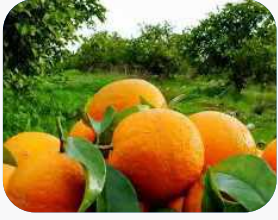
رئیس جهاد کشاورزی گیلان: برداشت ۱۰۰ هزار تن مرکبات در گیلان