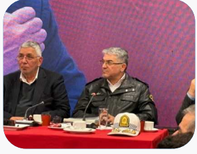
رئیس پلیس راهور: ۲۳۸۷ دوربین ترافیکی هیچ نخلفی ثبت نمیکنند