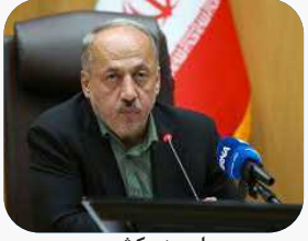
معاون وزیر کشور: ایجاد کارخانه های کمپوست واردات کود را ۷۰۰۱ تن کاهش داد