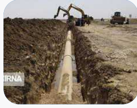
مدیر عامل آب و فاضلاب مازندران: طرح آبرسانی به ۹۵ روستای مجتمع خزر آبادسازی به مراحل پایانی رسید