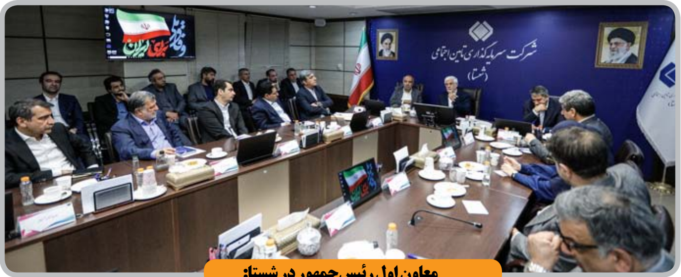
معاون اول رئیس جمهور در شستا: