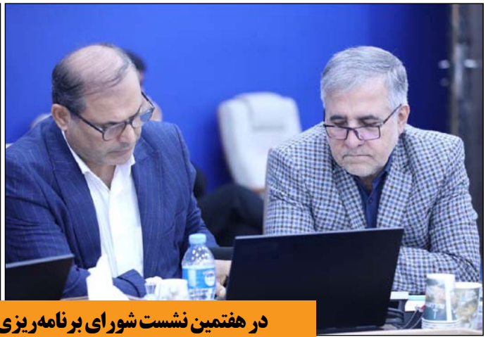
در هفتمین نشست شورای برنامه‌ریزی و توسعه استان مازندران مطرح شد