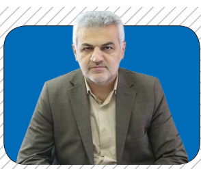
شتاب پروژه‌های نیمه‌تمام و تأمین مسکن مازندران با مولدسازی منابع راه‌سازی ۲