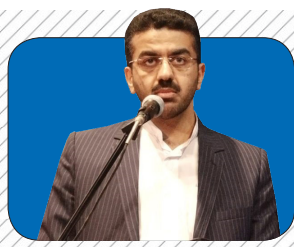
ابلاغ صدور گواهی انحصار وراثت به ادارات ثبت احوال در مازندران ۲