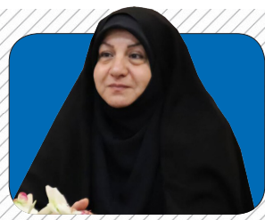
طرح «سلام» در محلات مازندران اجرایی شود ۲