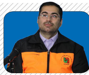
بهره‌برداری از ۷۶ پروژه حوزه راهداری مازندران در هفته دولت ۲