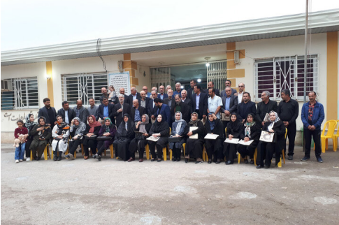
قرارمان می‌شود ساعت به وقت پنج عصر در یک مدرسه روستایی با اهالی مهربانی که برای معلمان سال‌های دور و نزدیک جشن گرفتند.

وی ادامه داد: همچنین در این مراسم از خانواده چهار فرهنگی فقید نیز با اهدای لوح یادبود تقدیر شده است. عکس یادگاری با حضور فرهنگیان و معلمان بازنشسته در کنار اعضای شوروی اسلامی و دهیار خیررودکنار، پایان بخش یک دوره‌می عصرانه بهاری و باصفا بوده است.