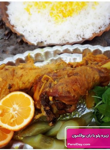
زیره پلو با ران بوقلمون ParsiDary.com

امروز یکی از خوشمزه ترین و خوش خوراک ترین ران بوقلمون را به همراه یک زیره پلواصیل کرمانی به شما یاد خواهیم داد که فوق العاده خوشمزه و ساده است و فقط ادویه ها مهم ترین قسمت تهیه آن هستند پس همه ادویه های گفته شده در مواد لازم را تهیه کنید و این غذای کرمانی را این بار با ران بوقلمون یاد بگیرید.