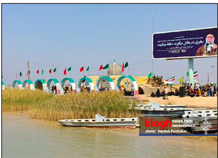
blogh news.com mazandaran.ir photo: Sepideh Purshaban