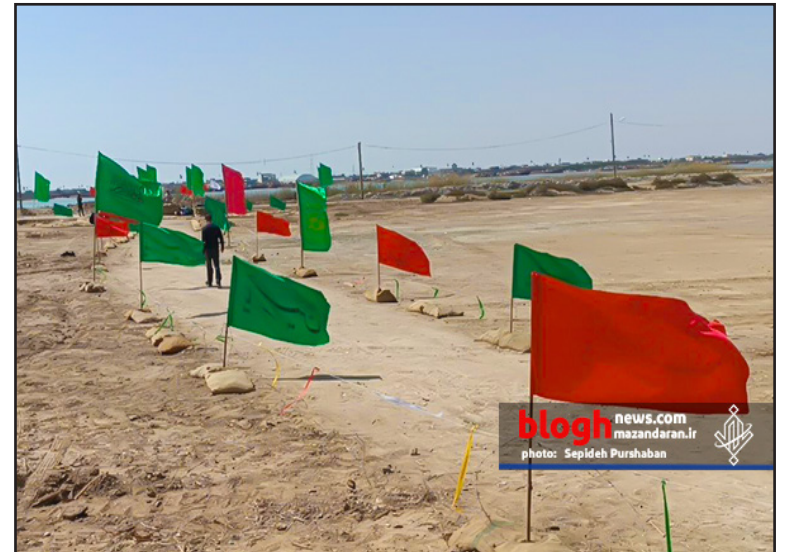
blogh news.com mazandaran.ir photo: Sepideh Purshaban