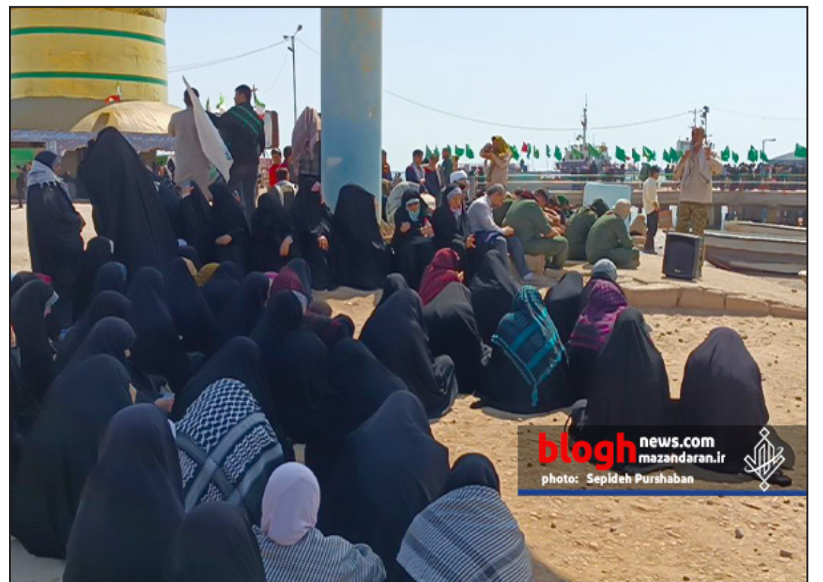
blogh news.com mazandaran.ir photo: Sepideh Purshaban