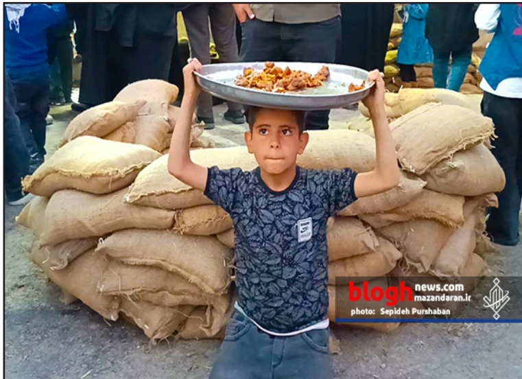
blogh news.com mazandaran.ir photo: Sepideh Purshaban