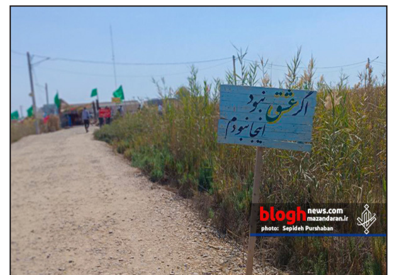
blogh news.com mazandaran.ir photo: Sepideh Purshaban