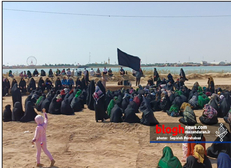
blogh news.com mazandaran.ir photo: Sepideh Purshaban