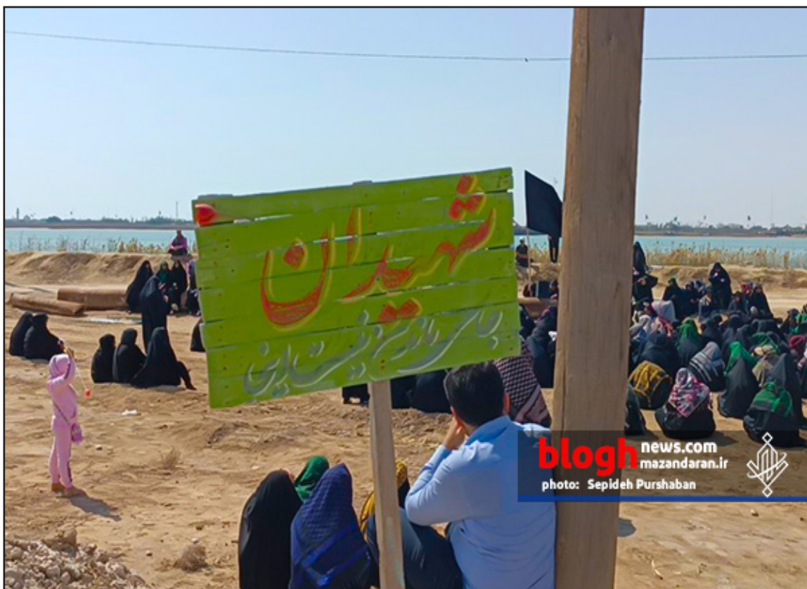
blogh news.com mazandaran.ir photo: Sepideh Purshaban