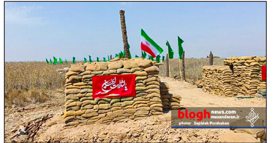
blogh news.com mazandaran.ir photo: Sepideh Purshaban