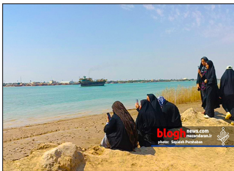
blogh news.com mazandaran.ir photo: Sepideh Purshaban