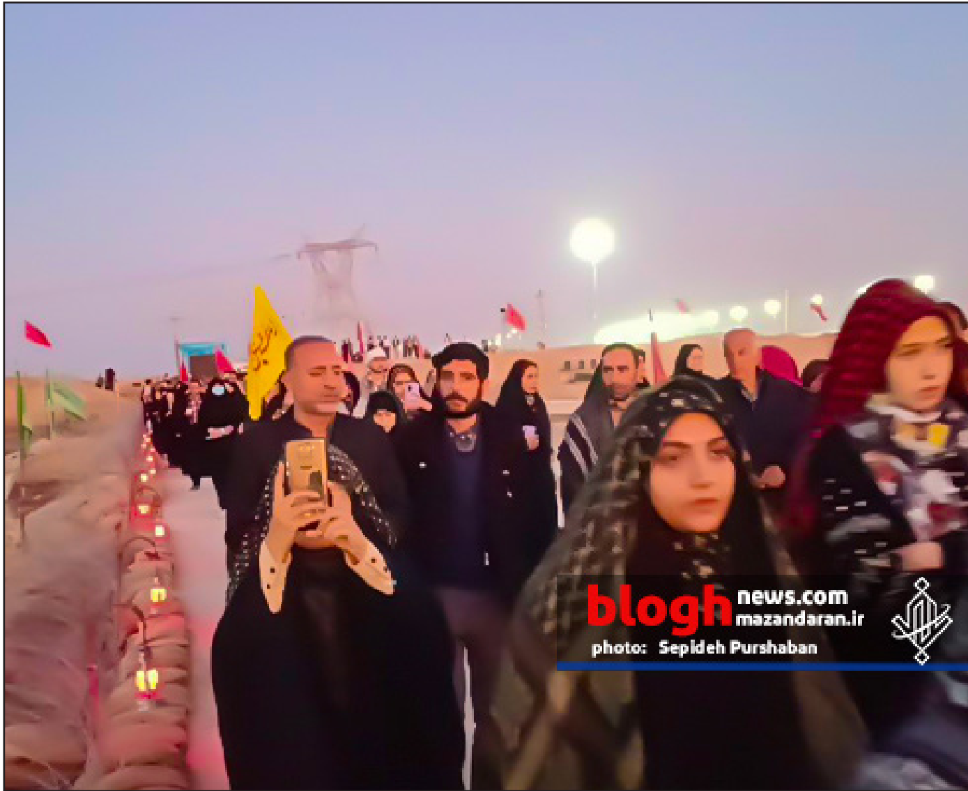
blogh news.com mazandaran.ir photo: Sepideh Purshaban

به گزارش نهضت شمال، سرزمین مجاهدت‌ها و رشادت‌های رزمندگان بی ادعای هشت سال دفاع مقدس محلی برای تجدید بیعت با آرمان‌های بلند بنیانگذار انقلاب اسلامی و شهدا شده است که همواره مورد استقبال عموم مردم و جوانان است. /بلاغ