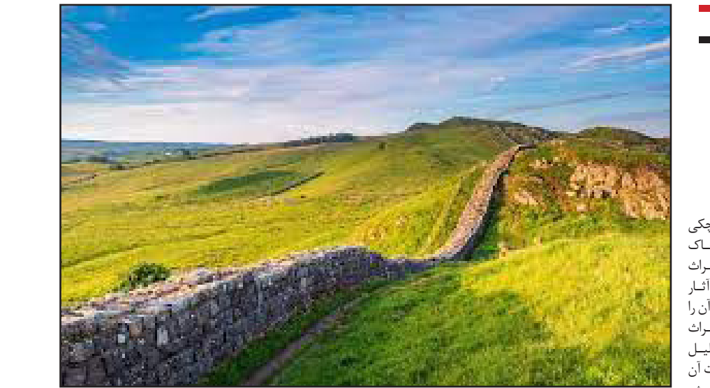
دیوار بزرگ گرگان در فصل بهار.

برای جلوگیری از خونریزی بینی و خونریزی های رجمی می توان از جوانه و برگ یونجه استفاده نمود. ویتامین کا موجود در یونجه باعث می شود تا انعقاد خون در بدن صورت بگیرد.